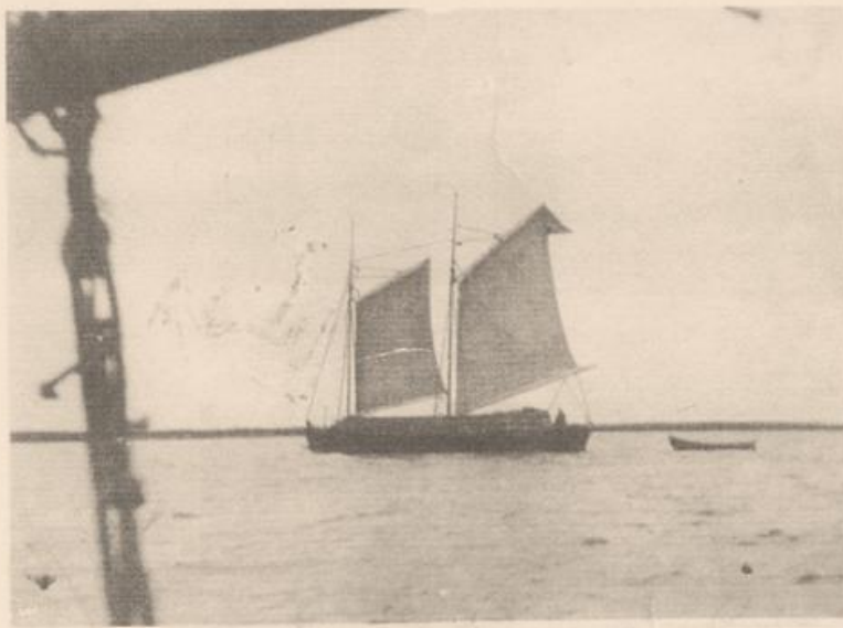
Vedskutan "EMMA" på Seskarö-fjärden lastad med ca 70 m 3 kastved - 1933

I början av 1900-talet var sjöfarten livlig längs kusten och upp mot Haparanda. Passagerarbåten "Haparanda" gick mellan Haparanda och Luleå långt in på 1920-talet. Hon fraktade inte bara passagerare utan även varor, som lossades vid stadskajerna i Haparanda. Många mindre båtar fraktade varor åt köpmän i staden medan andra fraktade egna varor. Det fanns båtar som fraktade ved. En av dem var "EMMA - Haparanda".